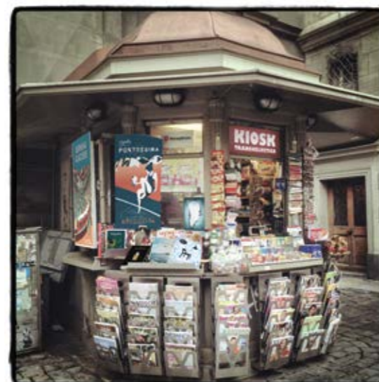
Die Agentur S. 39