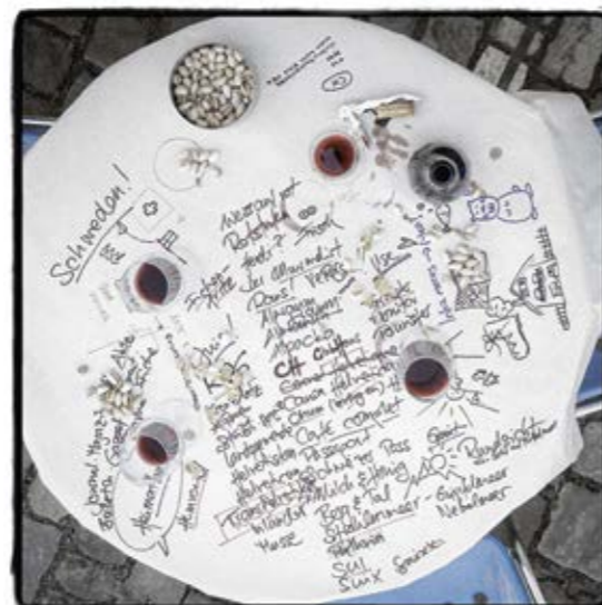
Der Name S. 15