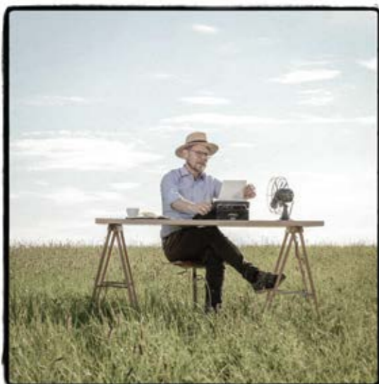
Das Büro S. 7