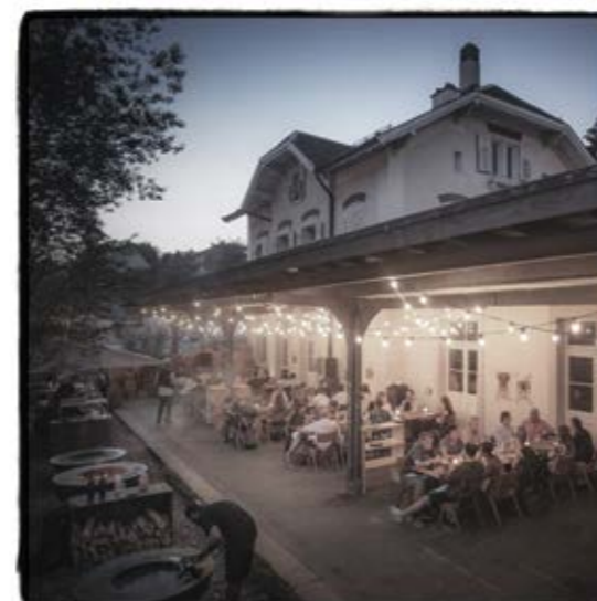
Die Tavolata S. 65