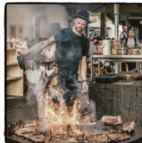
Der Tatort S. 87