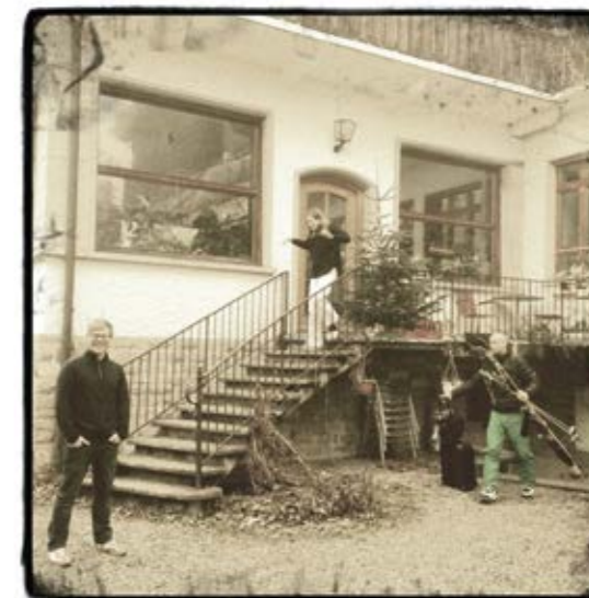
Das Hotel S. 55