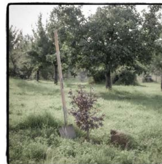
Die Kunst des Lebens S. 95