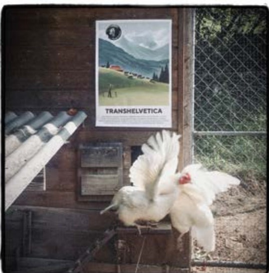
Die Partner S. 27