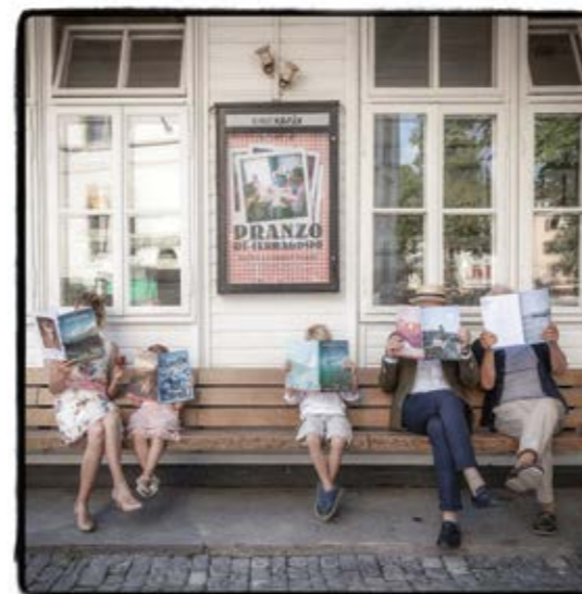
Die Leser S. 49

In zehn Jahren ist einiges passiert, kaum alles können wir in ein Magazin verpacken. Deshalb haben wir uns auf zehn transhelvetische Meilensteine beschränkt und jede Anekdote mit einer passenden Geschichte ergänzt.